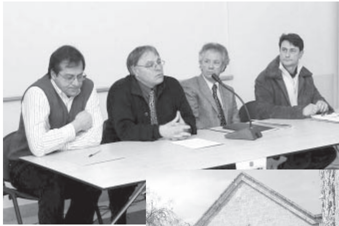
Un momento della conferenza di presentazione e Santa Maria della Giustizia

Le visite in Santa Maria della Giustizia, in Contrada Rondinella sulla SS 106 Jonica, sono gratuite si avvalorano della collaborazione di