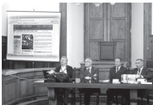
Il Punto costituirà un naturale riferimento per i giovani