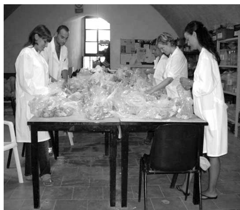
I giovani della cooperativa «Ethra» hanno lavorato anche al restauro dei materiali del Castello

Infine la «Ethra» ha presentato un progetto per la scuola primaria intitolato «Il Modellato - Conoscere e